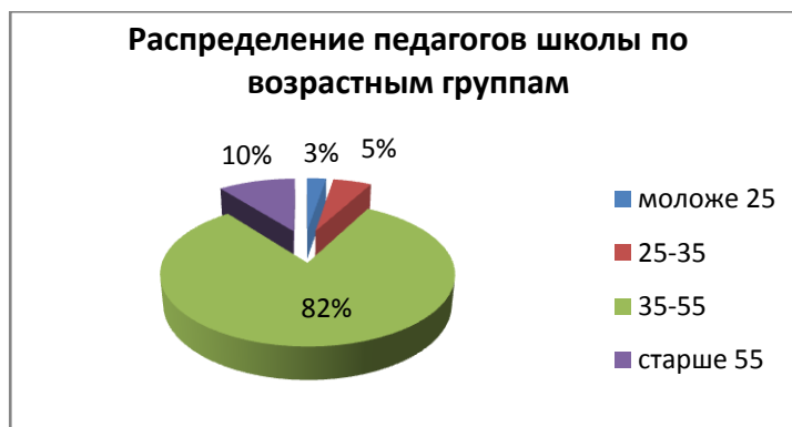
Рис. 4. – распределение педагогических работников по возрастным группам

В структуре педагогического коллектива представлены педагоги различных возрастных групп. 82% педагогических работников относятся к категории от 35 и старше. Это хорошо видно из рисунка 6.