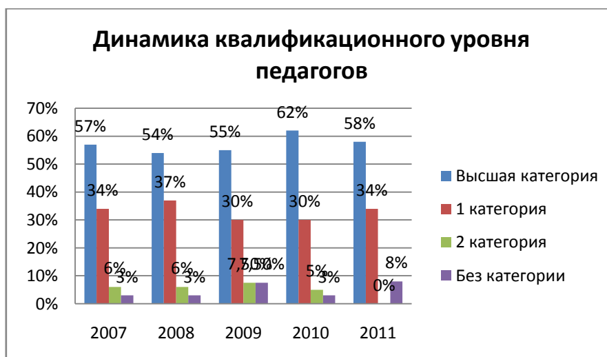
Рис.2. – динамика квалификационного уровня педагогических работников

Абсолютное большинство педагогических кадров на конец 2011-2012 учебного года имеют высшую (21 чел, 48,8 %) и первую квалификационную категорию (14 чел., 32,5%). Некоторое снижение удельного веса специалистов с высшей квалификационной категорией в 2012 году вызвано, во-первых, увеличением численного состава педагогического коллектива, во-вторых, новой процедурой аттестации педагогических кадров с января 2012 года. Данный факт обуславливает необходимость целенаправленной работы по подготовке педагогических кадров к новой процедуре аттестации, в том числе снятие психологических барьеров. Необходимо разработать и ввести в практику работы образовательного учреждения положение о портфолио педагогов. Соответствующие изменения хорошо заметны на рисунке 2.